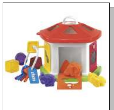
Dierencottage vanaf 12m

Meer info vinden jullie op de site www.chicco.be . Alle artikelen zijn verkrijgbaar op bestelling.