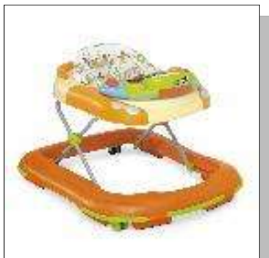
Eerste loopwagentje Chicco